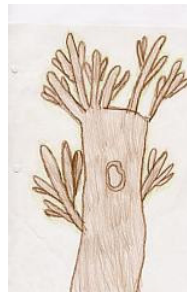
Tekeningen van Liz en Jack. De Botter, Edam

2. Doorleren en doordenken. Zien van de samenhang tussen de eigen levenssituatie en de maatschappelijke en culturele verhoudingen. Spelen vooroordelen een grote rol in onze beoordeling, ons gedrag en onze houding?